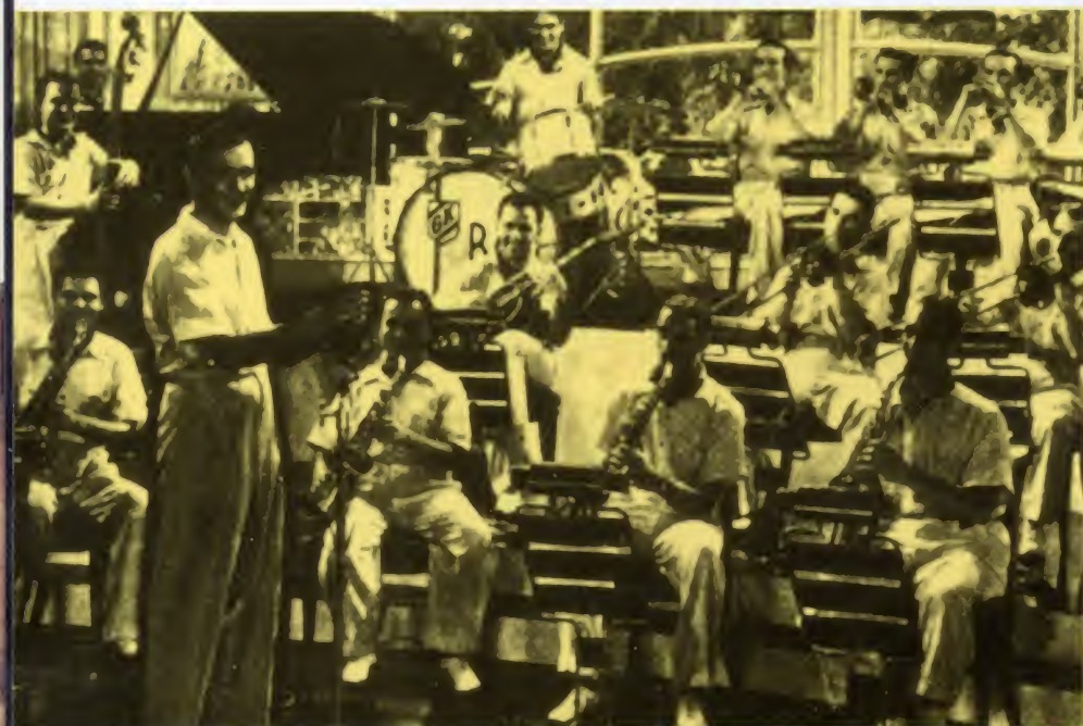
La orquesta de Benny Goodman en 1937. (El baterista es Gene Krupa; Harry James es el primer trompetista por la izquierda; Allan Reuss, a la guitarra; y Jess Stacy, al piano.)